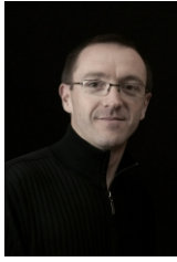
Jean-William CHALOPIN Auteur Photographe