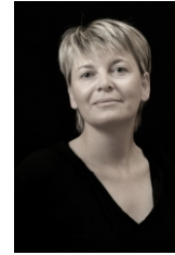
Rachel CHALOPIN Photographe professionnel

Amateurs de treks dans le Grand Nord en autonomie totale, de randonnées hivernales en France et de photographies, notre attirance pour les grands espaces nous a conduit à maintes reprises dans les contrées boréales (Islande, Groenland, Spitzberg, Laponie Suédoise...) mais c'est également chez nous, en Auvergne, que nous pouvons assouvir notre recherche d'immensité.